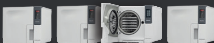
Cube PST 1710 Cube PST 2210 Cube X PST 1720 Cube X PST 2220

*La promozione comprende gli sterilizzatori Cube e Cube X (PST 1710, PST 2210, PST 1720, PST 2220) e i termodisinfettori (PG 8581, PG 8591, PWD 8531, PWD 8532). Per ogni termodisinfettore e sterilizzatore da banco acquistato, il bonus ammonta a CHF 900 lordi. Il bonus componenti massimo ammonta a CHF 1'800 lordi all'acquisto di un termodisinfettore e di uno sterilizzatore da banco in un unico ordine. Periodo della promozione: dal 01.04.2021 al 31.07.2021