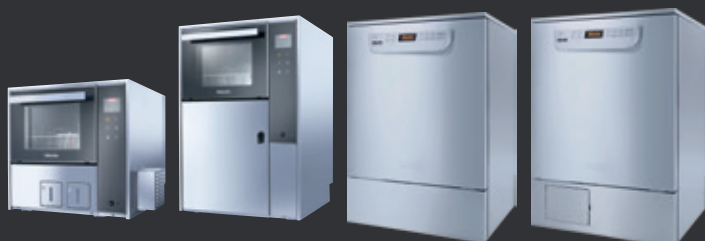
PWD 8531 PWD 8532 PG 8581 PG 8591