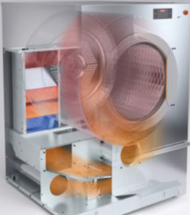
Funktion AirRecycling Flex