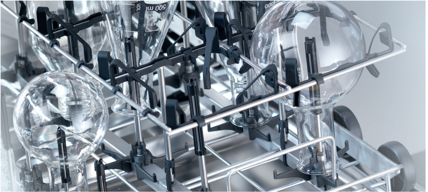
Abb.: Beladungsmodul mit eingesetztem Haltegitter