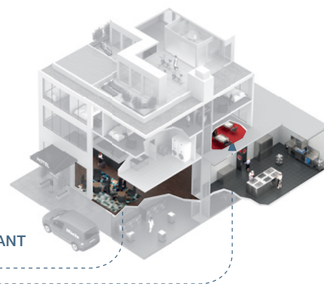
BAR &amp; RESTAURANT

In Hotellerie und Gastronomie haben einwandfreies Geschirr, saubere Gläser und reines Besteck einen hohen Stellenwert. Zusätzlich sollen höchste wirtschaftliche und hygienische Standards erfüllt werden. Die optimale Lösung dafür bietet das Miele System4Shine.