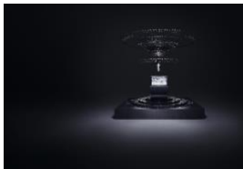
Foto 2: Le lavastoviglie Miele sono testate per durare 20 anni. 20 anni di brillantezza impeccabile. E oltre 590'000 litri di acqua risparmiati. (Foto: Miele)

Foto 1: Risultati brillanti, giorno dopo giorno. Testate per 5'600 ore di esercizio. (Foto: Miele)