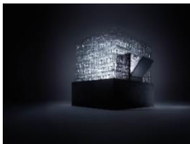
Foto 1: Risultati brillanti, giorno dopo giorno. Testate per 5'600 ore di esercizio.