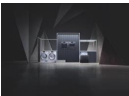
Foto 5: Da oltre 120 anni, Miele non si accontenta mai del meglio. Miele produce apparecchi all'avanguardia, destinati a durare 20 anni. (Foto: Miele)

Foto 4: Mega poster sulla Uraniastrasse a Zurigo. (Foto: Miele)