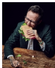
Foto 1: Thomas Meyer, autore svizzero di bestseller, ha scritto la storia esclusiva per la campagna "Leaterature".