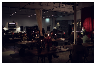
Foto 6: fotografia dell'evento "Leaterature" tenutosi presso VN Residency a Zurigo.