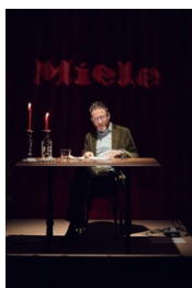
Foto 5: fotografie dell'evento "Leaterature" tenutosi presso VN Residency a Zurigo.