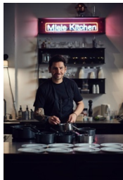
Foto 4: fotografia dell'evento "Leaterature" tenutosi presso VN Residency a Zurigo.