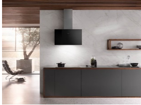
Foto 3: Una semplice canna fumaria in acciaio inox completa la cappa a evacuazione dell'aria.

Download testi e foto: www.miele-presse.ch