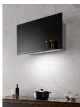
Foto 1: Richiama l'attenzione di tutti: con la sua ridotta profondità strutturale e il design minimalista, la nuova cappa aspirante a parete DA 9090 W Screen si integra in qualsiasi ambiente cucina essenziale. Qui nel colore nero ossidiana