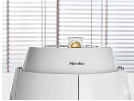
Foto 3: Le fragranze SummerGarden, FrenchBakery e MintyFields, disponibili solo da Miele, garantiscono una profumata esperienza sensoriale (AmbientFragrance). I flaconi con essenze profumate rinfrescano la cucina per un totale di 150 ore e vengono inseriti nella cappa dall'alto. Con l'app Miele@mobile è possibile impostare individualmente gli intervalli e i tempi desiderati.