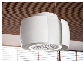
Foto 2: Da rotonda diventa ovale: all'accensione, le ali del corpo cappa si aprono (Hood in Motion) e ingrandiscono automaticamente la camera di aspirazione. (Foto: Miele)

Foto 1: Molto più di una semplice cappa aspirante a ricircolo: Aura 4.0 Ambient combina un design eccezionale, un'illuminazione ambientale individuale e fragranze delicate per un clima piacevole e comandi intelligenti. (Foto: Miele)