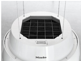
Foto 4: Durante la cottura, l'innovativa funzione HumidityBalance assicura la cattura dell'umidità. Misurando l'umidità ambientale e la temperatura, un sensore determina il momento ottimale per il rilascio dell'umidità immagazzinata nel filtro. (Foto: Miele)

Foto 3: Le fragranze SummerGarden, FrenchBakery e MintyFields, disponibili solo da Miele, garantiscono una profumata esperienza sensoriale (AmbientFragrance). I flaconi con essenze profumate rinfrescano la cucina per un totale di 150 ore e vengono inseriti nella cappa dall'alto. Con l'app Miele@mobile è possibile impostare individualmente gli intervalli e i tempi desiderati. (Foto: Miele)