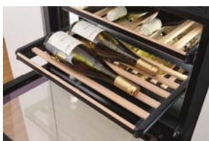
Foto 3: Le griglie in legno si possono orientare anche nell'altro senso per sistemare comodamente all'interno dell'enoteca Miele bottiglie più lunghe.