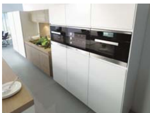
Foto 4: In perfetta sintonia anche con altri elettrodomestici da incasso Miele, ad esempio un forno a vapore: la nuova enoteca climatizzata Miele trova posto in un vano di appena 45 centimetri.