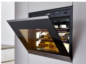
Foto 2: Sufficiente spazio per 18 bottiglie bordolesi e uno sportello che si apre silenziosamente sono solo due degli eccezionali attributi della nuova enoteca climatizzata incassabile KWT 6112 iG realizzata da Miele.