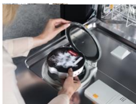
Photo 3 : AutoDos est le premier système de dosage automatique au monde avec PowerDisk intégré. Le lave-vaisselle et les granulés de poudre exclusifs deviennent ainsi un système coordonné avec précision – le dosage se fait en fonction du programme et au moment optimal. (Photo : Miele)

Photo 2 : Depuis 2017, Miele répond au besoin croissant de compatibilité optimale avec la peau et l'environnement avec sa gamme de produits "Sensitive". Tous les produits sont exempts de parfums, de colorants et de polymères synthétiques. Sur la photo : Les produits de lessive TwinDos UltraPhase 1 et 2 Sensitive. (Photo : Miele)