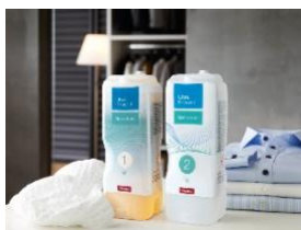
Photo 2 : Depuis 2017, Miele répond au besoin croissant de compatibilité optimale avec la peau et l'environnement avec sa gamme de produits "Sensitive". Tous les produits sont exempts de parfums, de colorants et de polymères synthétiques. Sur la photo : Les produits de lessive TwinDos UltraPhase 1 et 2 Sensitive. (Photo : Miele)

Photo 1 : Nouvelle ligne de produits "ECO" pour un lavage de la vaisselle plus respectueux de l'environnement : le PowerDisk All in 1 ECO, qui fait partie du système de dosage automatique des lave-vaisselle Miele, et les UltraTabs All in 1 ECO sont exempts de parfums, de conservateurs et de colorants, contiennent des ingrédients d'origine végétale, ont une très bonne biodégradabilité et ne contiennent pas de benzotriazole, un agent protecteur de l'argent. (Photo : Miele)