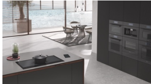
Photo 1 : Le plan de cuisson KM 7897 FL, qui a remporté un iF Product Design Award en or, s'intègre avec élégance et sobriété dans la cuisine.