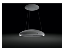
Photo 1 : Design autonome au-dessus du plan de cuisson : l'Aura 3.0 de Miele a reçu l'iF Product Design Award.