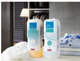
Foto 2: Mit den Produkten der Ausrichtung „Sensitive“ erfüllt Miele seit 2017 das wachsende Bedürfnis nach bestmöglicher Haut- und Umweltverträglichkeit. Alle Produkte sind frei von, Duft- und Farbstoffen und synthetischen Polymeren. Im Bild: Die TwinDos-Waschmittel UltraPhase 1 und 2 Sensitive. (Foto: Miele)

Foto 1: Neue Produktlinie „ECO“ für umweltfreundlicheres Geschirrspülen: Die PowerDisk All in 1 ECO als Teil des automatischen Dosiersystems in Miele-Geschirrspülern und die UltraTabs All in 1 ECO sind frei von Duft-, Konservierungs- und Farbstoffen, beinhalten pflanzenbasierte Inhaltsstoffe, haben eine sehr gute biologische Abbaubarkeit und verzichten auch auf das Silberschutzmittel Benzotriazol. (Foto: Miele)