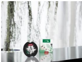
Foto 1: Neue Produktlinie „ECO“ für umweltfreundlicheres Geschirrspülen: Die PowerDisk All in 1 ECO als Teil des automatischen Dosiersystems in Miele-Geschirrspülern und die UltraTabs All in 1 ECO sind frei von Duft-, Konservierungs- und Farbstoffen, beinhalten pflanzenbasierte Inhaltsstoffe, haben eine sehr gute biologische Abbaubarkeit und verzichten auch auf das Silberschutzmittel Benzotriazol.